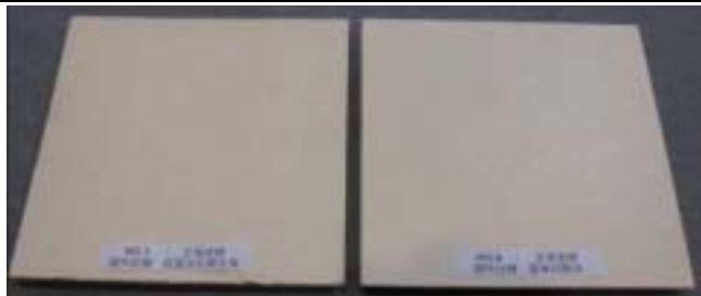
【促進劣化後試験体】 【基準試験体】