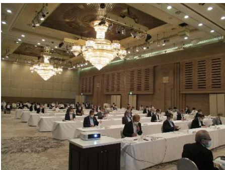
全体会議会場の様子

今年度も昨年度と同様フォーラムに設置した3つの部会の活動を中心として、良好な温熱環境の実現に向けた一般ユーザー、住宅事業者に対する具体的な取組み、国等の住宅施策等への反映に向けた検討・提案等を参加団体と連携して実施してまいります。