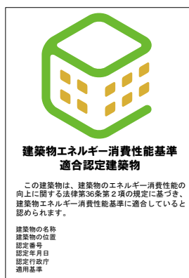
建築物省エネ法第36条 認定表示