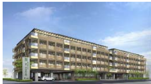
枠組壁工法による5階建特別養護老人ホーム