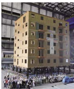
2009 NEESWOOD Project