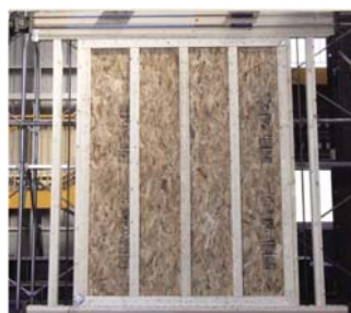
2012 面内せん断試験 (COFI・日本システム設計)