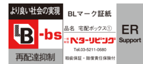
ERS BL マーク証紙

交換修理支援サービスの支給対象部品は、当財団が発行している「ERS BLマーク証紙」が貼付されている宅配ボックス(単独型)(以下「ERS BL部品」という)となります。