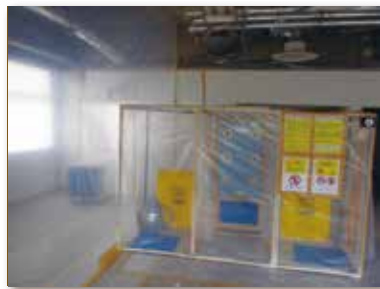
2. セキュリティゾーン設置状況