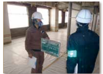
3. 隔離養生検査状況