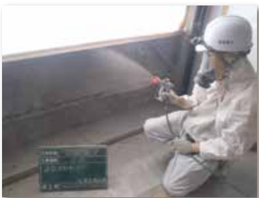
4. 飛散抑制剤散布状況