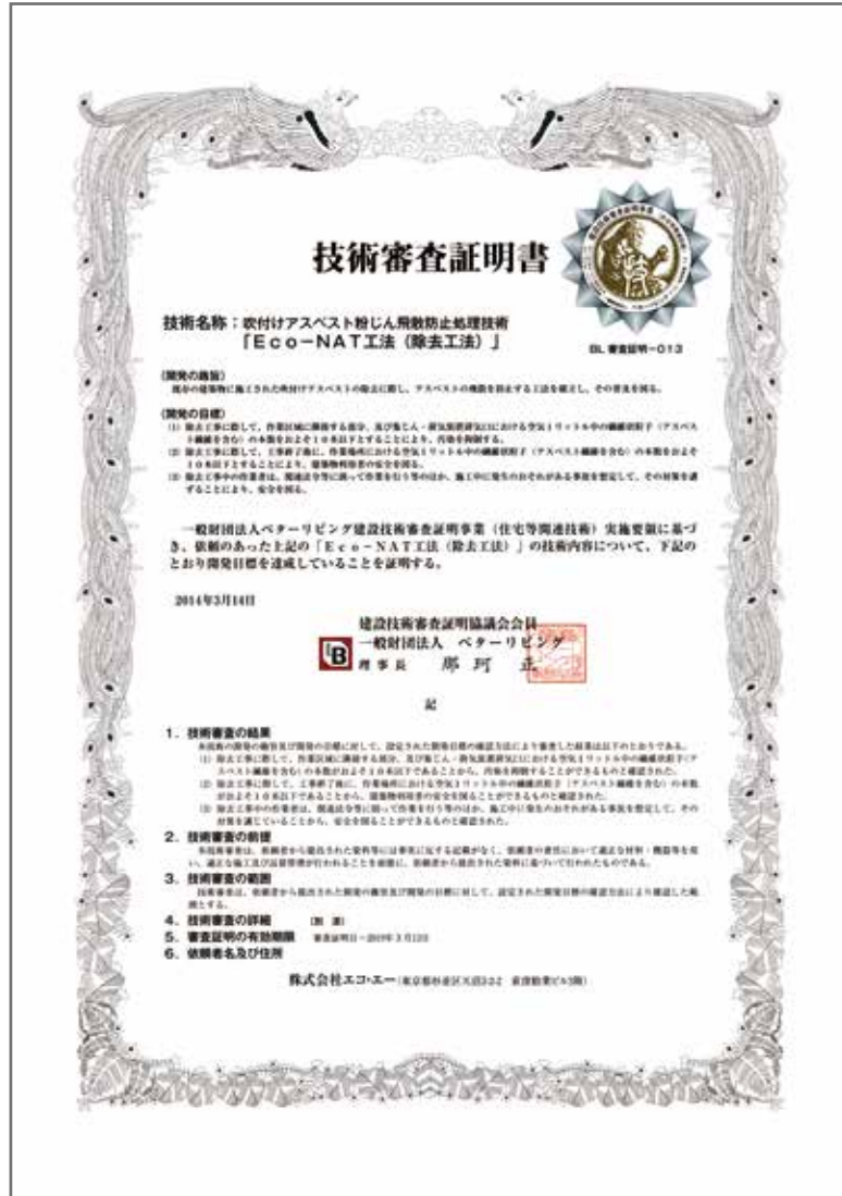
技術審査証明書(縮小版)