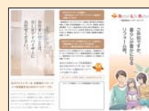
▲アドバイザー紹介 パンフレット