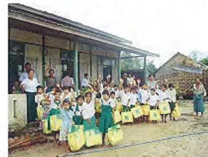
ヤンゴン管区トンテイにて

2008年6月、JCVスタッフは、5月にミャンマーを襲ったサイクロン「ナルギス」によって被災された地域の皆さまの生活や予防接種の状況を視察しました。写真は、子どもがビタミンAを摂取しているところです。